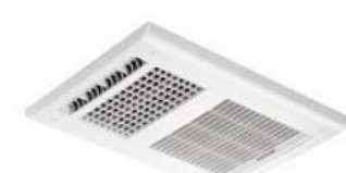
100Vタイプの換気暖房乾燥機